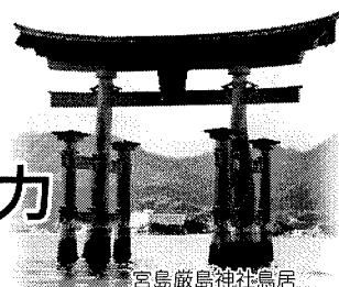
宮島厳島神社鳥居